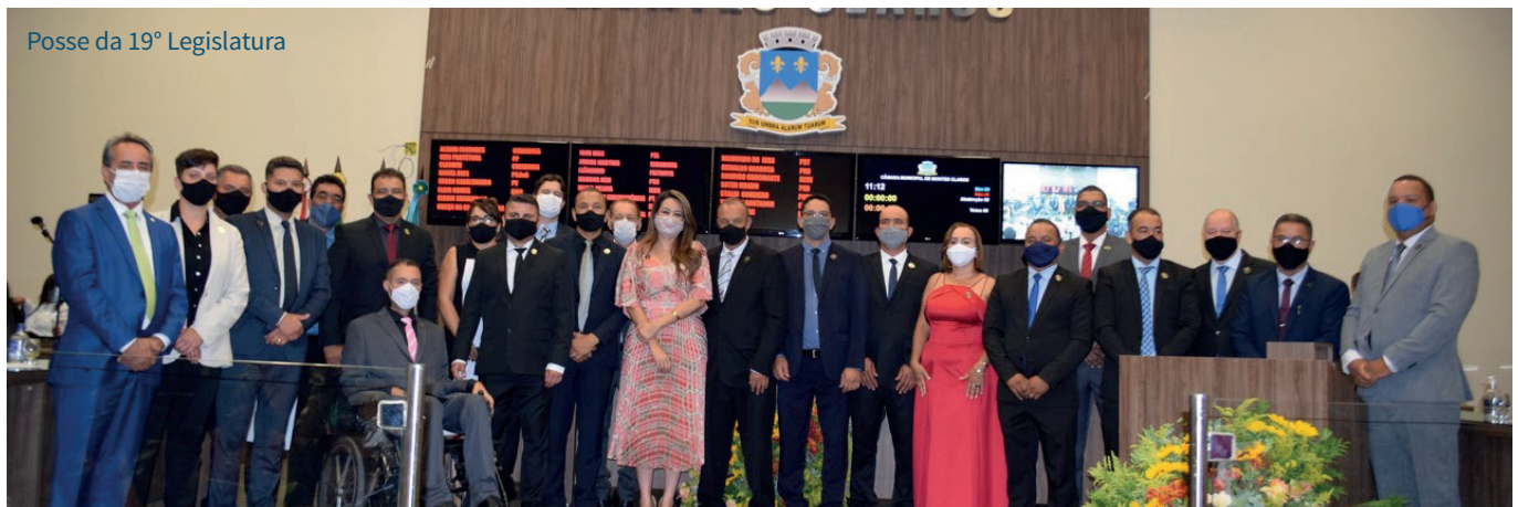
Posse da 19ª Legislatura

Os dois primeiros anos da 19ª Legislatura da Câmara Municipal de Montes Claros foram de grandes desafios. Dos 23 vereadores eleitos para o exercício 2021/2024, dez exerceriam o mandato pela primeira vez e 13 foram reeleitos. Mas a expectativa de início de mandato, comum a todos os parlamentares, se somava à apreensão causada pela pandemia de Covid-19.