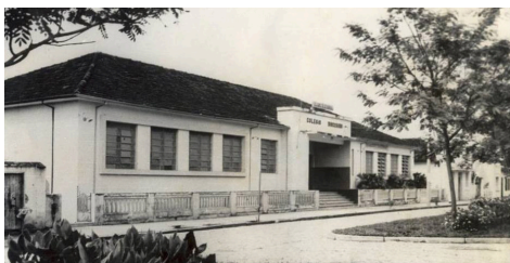
Prédio na Avenida Coronel Prates, que sediou a Câmara em 1967