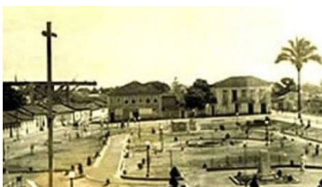
Vista de frente da antiga Cadeia, Fórum e Câmara (entre o Solar dos Oliveira e a esquina da rua Simeão Ribeiro)