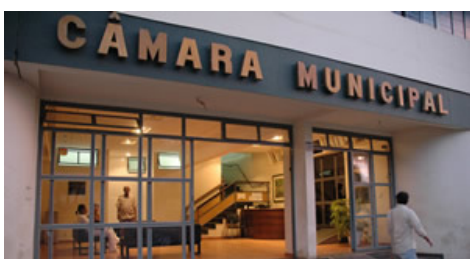
Sede da Câmara à Avenida Dr. João Luiz de Almeida