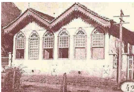
Praça Doutor Chaves (Praça da Matriz), onde hoje se localiza o Centro Cultural Hermes de Paula