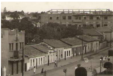
Câmara Municipal de Montes Claros, até a década de 1950, ao lado do prédio, onde, hoje, funciona os Correios