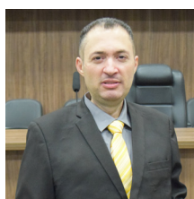
Rodrigo Maia de Oliveira REDE